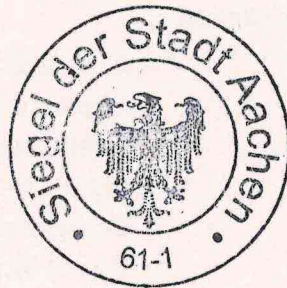
(Sibylle Keupen) Oberbürgermeisterin